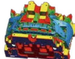
3D モデルを次工程へ