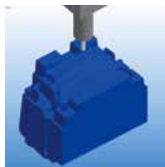
シュミレーション (セルフチェック)