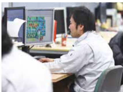
三次元(3D)設計データ作成工程

顧客から支給された完成品データ(図①)を基に最先端の三次元CADシステムとCADソフトウェアを用いて、蓄積された樹脂成型の高度なノウハウと経験に基づき、コンピュータ上で数百点から数千点になる金型構成部品とそれらを組み立てた完成品の三次元金型の設計(図②)を行います。