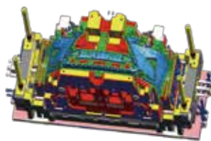
図② 三次元設計された金型 (可動型)